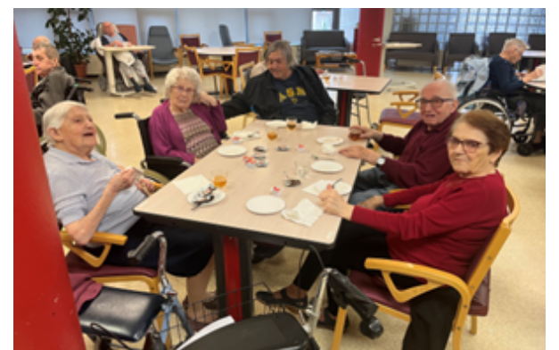
Régal pour la Chandeleur dans tous les services.