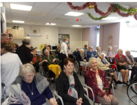
Voeux de M le Maire et de Mme la Directrice