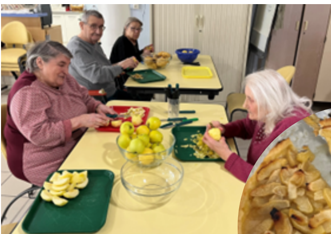
Après l'effort... le réconfort