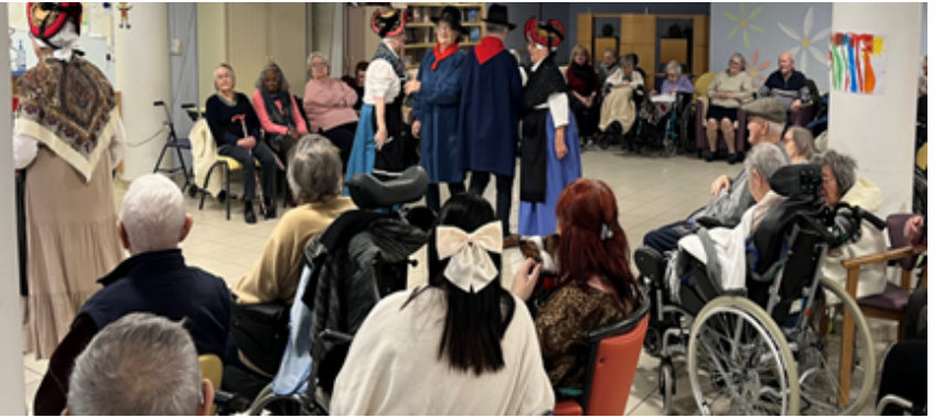
Visite du groupe folklorique « les sabots dorés ».