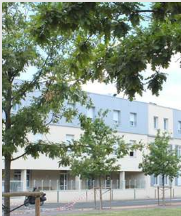
Côté Cours Rue Charles Louis Philippe