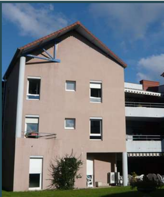
Hôtel Dieu - Place du Centenaire -